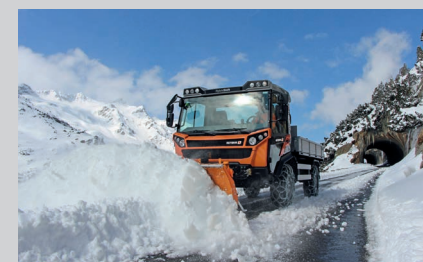
Muli T10 X с откидной платформой и отвалом