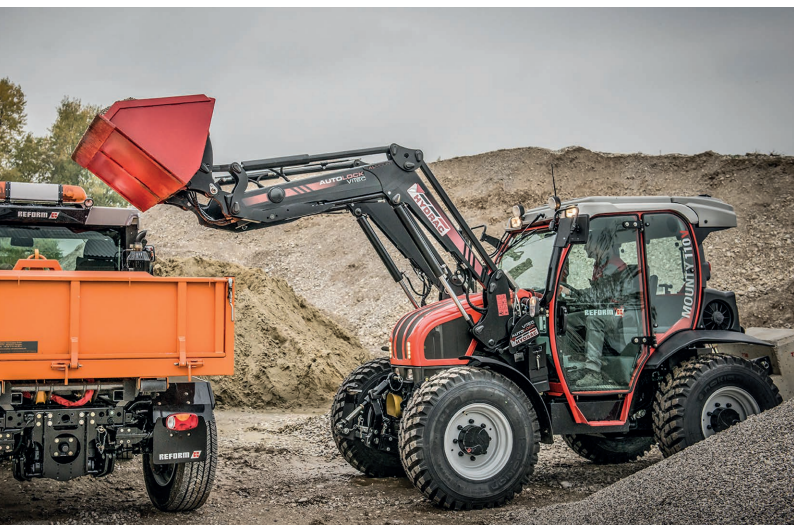
Moutny 110 V с фронтальным погрузчиком