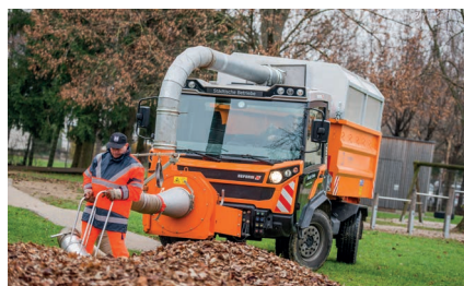
Muli T10 X с насадкой для уборки листьев

Эксплуатация с подметальной насадкой возможна на всех продуктах «REFORM». Оснащенные водяными баками, машины Muli и Voki можно использовать для полива клумб и расчистки. С помощью «REFORM» возможно ухаживать за многочисленными зелеными насаждениями и парковыми аллеями.