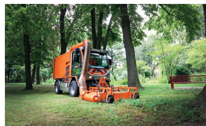
Voki HY 1352 с насадкой для кошения и уборки скошенной травы