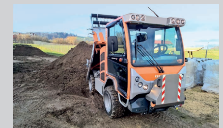
Boki HY 1252 с откидной платформой