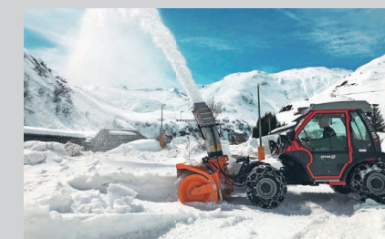
Metrac H9 X со шнекоротором