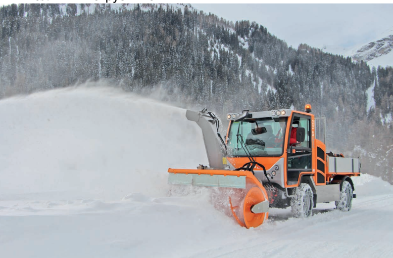
Вокi НУ 1352 со шнекоротором