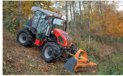
Mounity 110 V с мульчером

Чтобы справиться с растительностью на склонах, часто используют косилки и мульчеры. Модели Metrac и Mounity идеально подходят для любых работ по уходу и облагораживанию склонов. «REFORM» предлагает разнообразие косилок, а также мульчеров для выкорчевывания корней кустарников и растений. А в комбинации с сеялкой склоны можно еще и засеять.