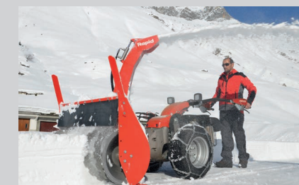
Гидрокосилка RM25 со шнекоротором