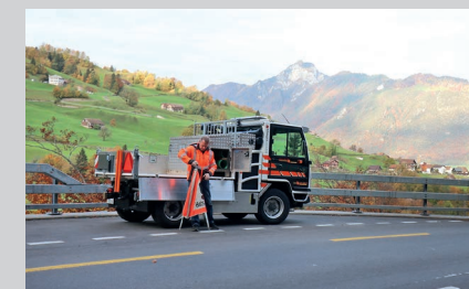
Boki HY 1352 с откидной платформой