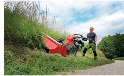
Гидрокосилка RM18 с мини-мульчером