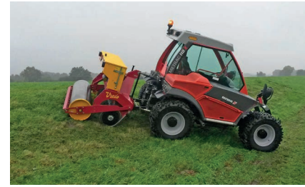
Metrac H8 X с сеялкой