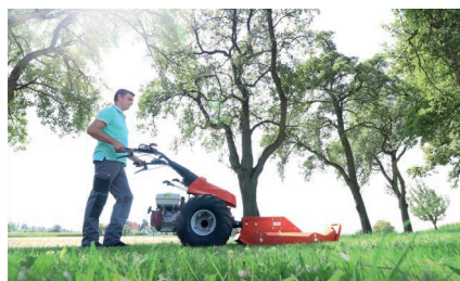
Motech CM626 D с мульчером