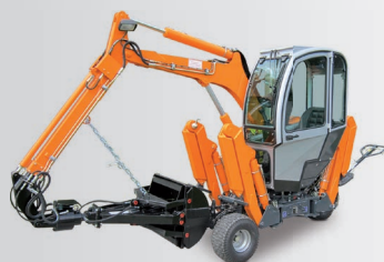
Вокі с ковшом