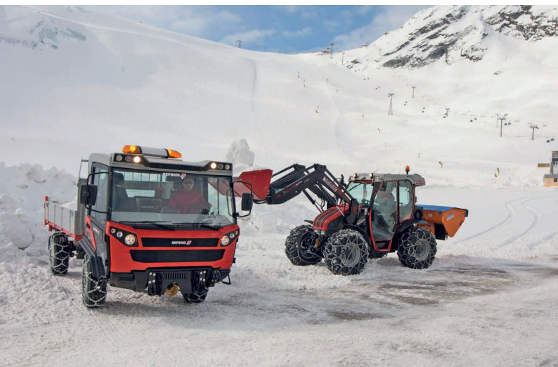
Muli T10 X с откидной платформой и Mounty 110 V с фронтальным погрузчиком