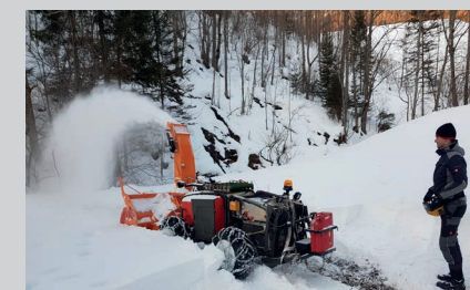
Metron P48 RC со шнекоротором