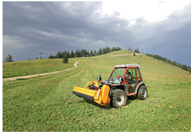
Метраc Н9 Х с мультчером