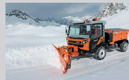
Muli T10 X с отвалом и разбрасывателем