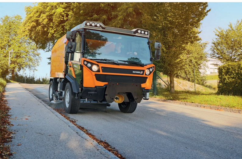
Muli T10 X с подметальной насадкой