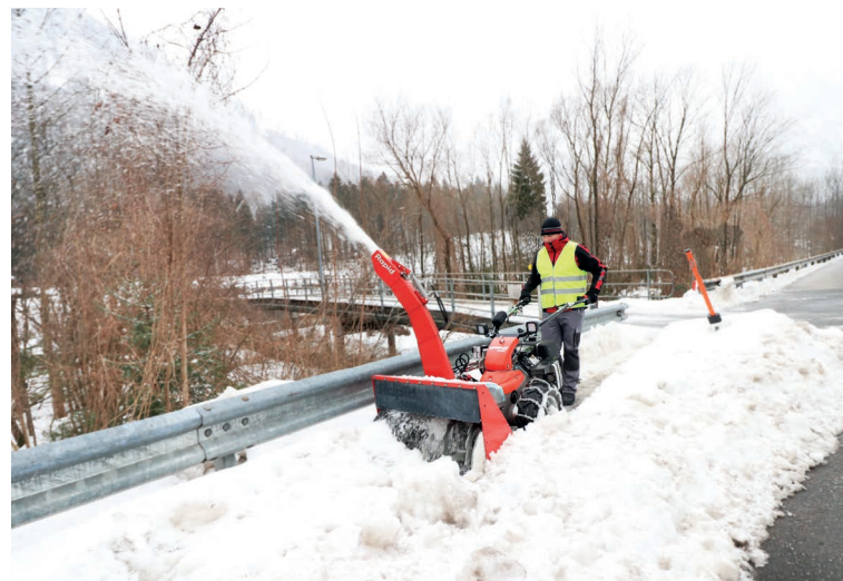
Гидрокосилка RM18 с мини-шнекоротором