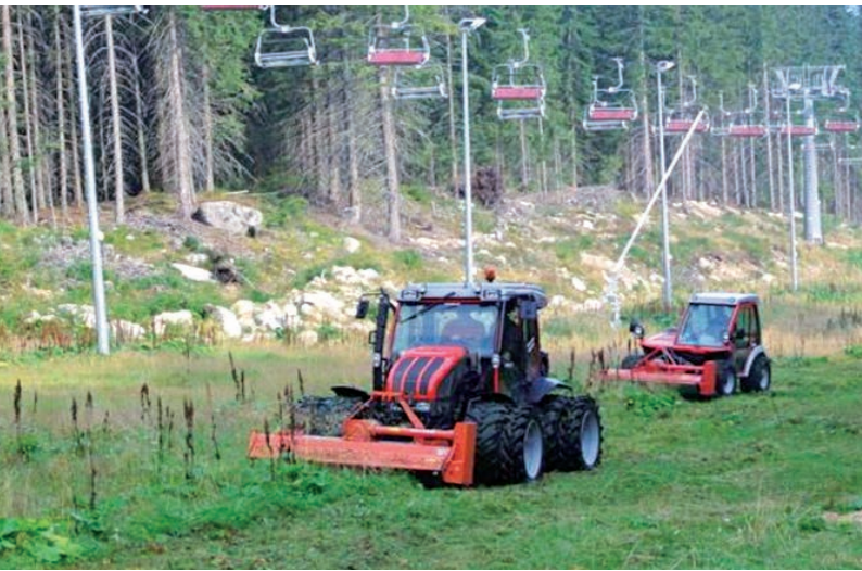
Mounty 110 V и Metrac с дисковой косилкой