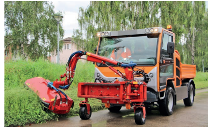
Boki 1152 с косилкой