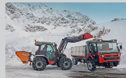
Muli T10 X с откидной площадкой и Mounity 110 V с фронтальным погрузчиком.

Даже проблематичные ситуации, связанные с перевозкой грузов, можно легко решить с помощью техники от «REFORM». Модель «Boki» отлично проходит даже в очень узком пространстве благодаря своей узкой колесной базе и полному приводу. Модель «Muli», в которой сочетаются характеристики высокой грузоподъемности, малого собственного веса, полноприводного режима и уникального шасси, великолепно справляется с транспортировкой материалов на склонах. Благодаря высокой маневренности модели «Mounity» материалы могут быть разгружены даже в очень ограниченном пространстве.