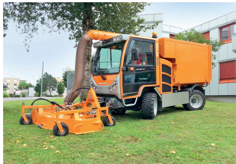
Voki NY 1252 с косилкой и устройством для уборки скошенной травы