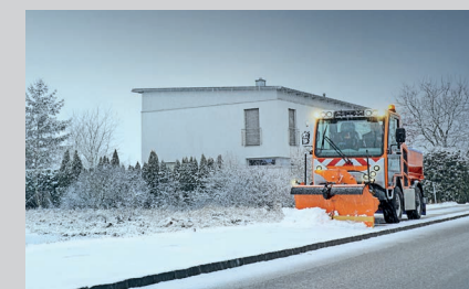
Voki HY 1252 с отвалом