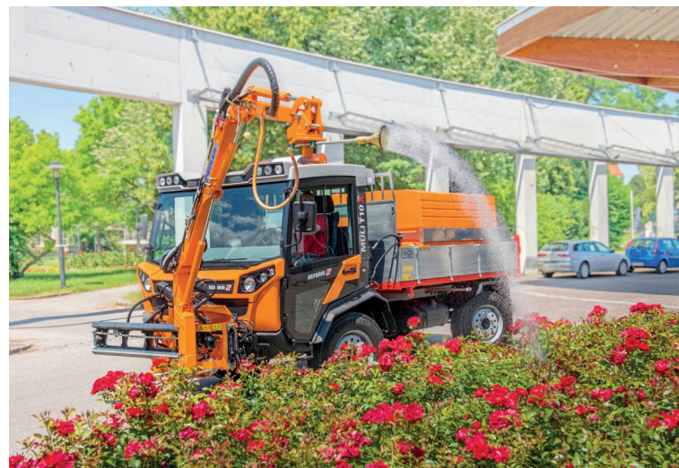
Muli T10 X с поливальной установкой