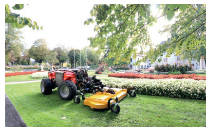
Metron P48 RC с дисковой косилкой