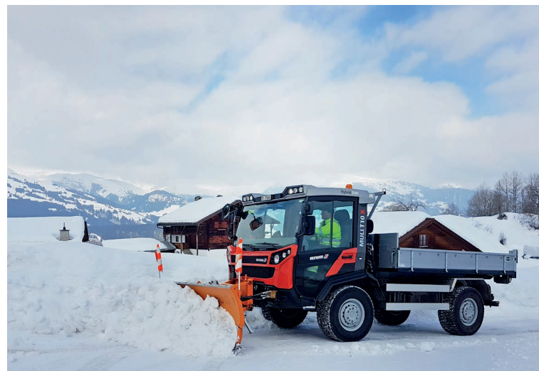
Muli T10 X с отвалом